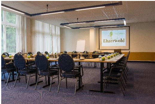
De Vrije Vogel zaal