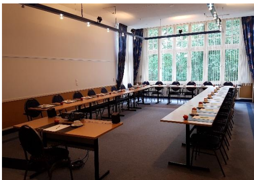
Berkelzaal 2/ Berkelzaal 3